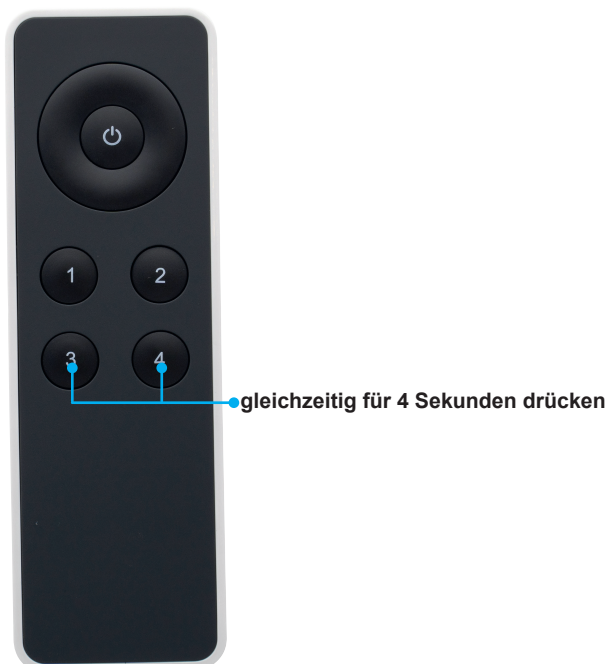
[Bild 9] Connect Mesh Eco Fernbedienung, Hinzufügen von weiteren Boxen

Um weitere 4-fach Verteiler Connect Mesh Eco zu Ihrem Netzwerk hinzuzufügen drücken Sie bei der Connect Mesh Eco Fernbedienung die Kanaltasten 3 und 4 gleichzeitig für 4 Sekunden.