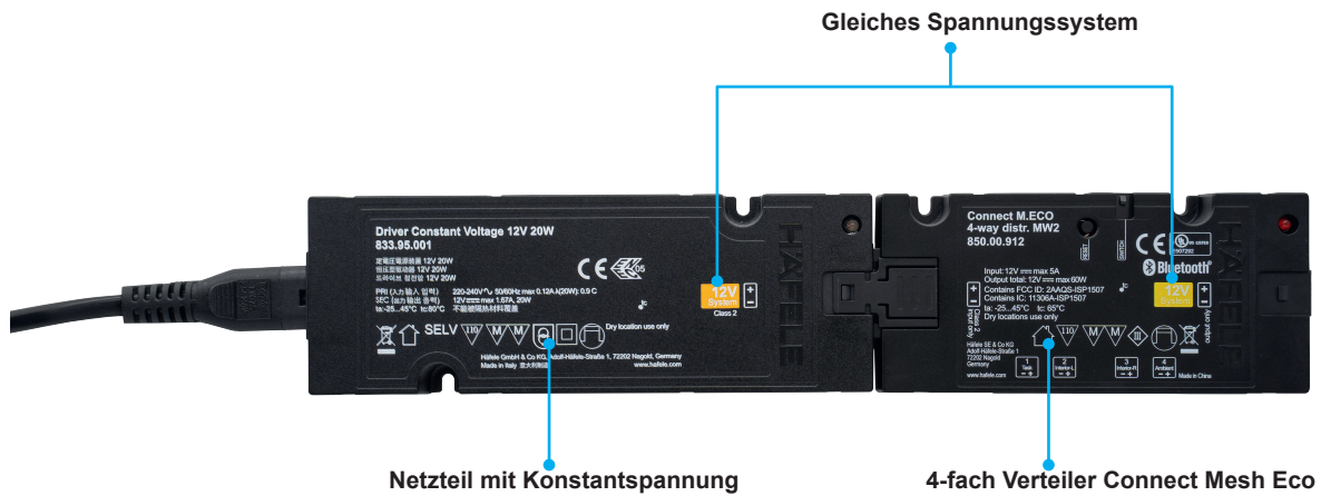
[Bild 3] Installation 4-fach Verteiler Connect Mesh Eco und Netzteil (Beispiel zeigt 12V Version)