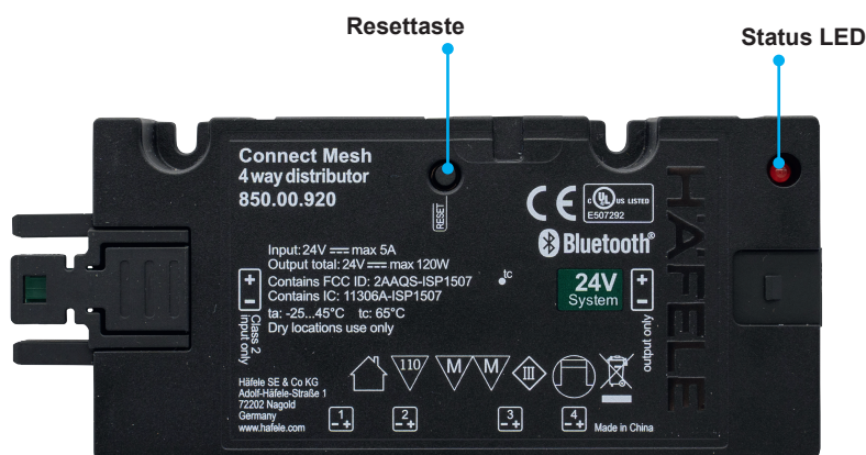
[Bild 7] 4-fach Verteiler Connect Mesh Eco, Zurücksetzen (Beispiel zeigt 24V monochrome)

Drücken Sie die Resettaste für mindestens 8 Sekunden und lassen Sie sie dann los. Dadurch wird das Connect Mesh-Gerät zurückgesetzt. Die Status-LED beginnt zu blinken.