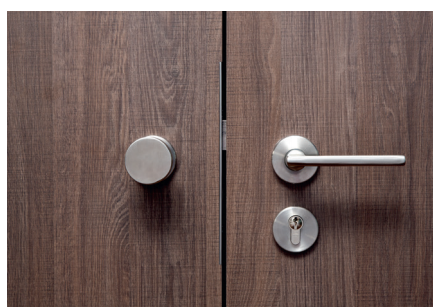
Startec Türdrücker eignen sich für hohe Belastungen zum hervorragendem Preis-/Leistungsverhältnis.