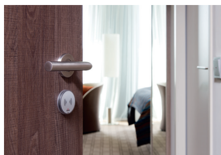
Dialock Türterminal DT 400 an der Hotelzimmertür.