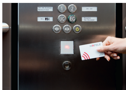
Dialock Wandterminal WT 130 im Siedle Design zur Aufzugsteuerung.